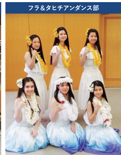
フラ&タヒチアンダンス部