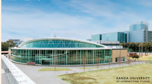
KANDA UNIVERSITY OF INTERNATIONAL STUDIES