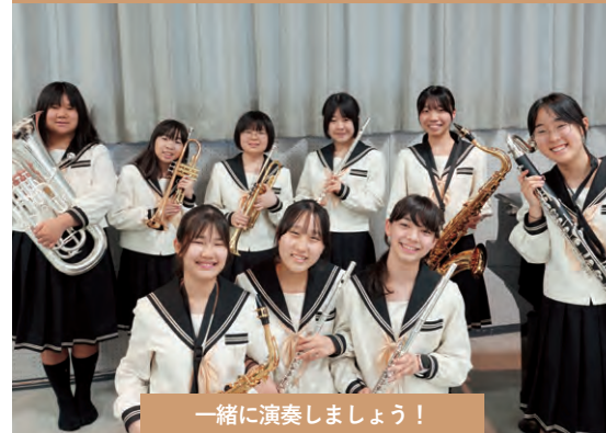
一緒に演奏しましょう！