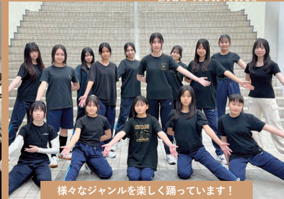
様々なジャンルを楽しく踊っています！