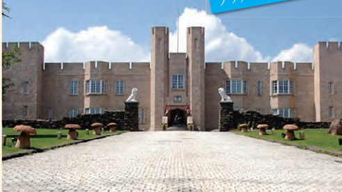
プリティッシュヒルズ