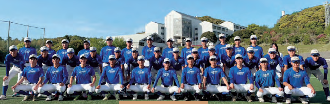
チーム一丸で頑張ります！